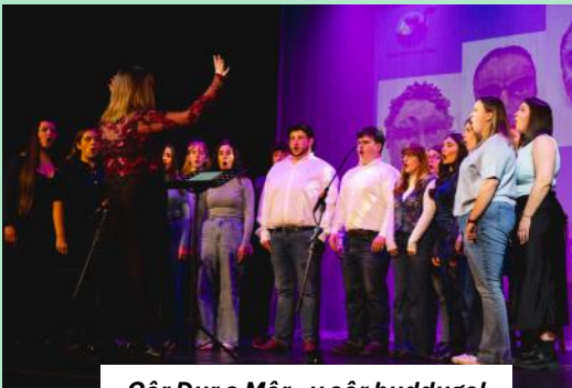
Côr Dur a Môr - y côr buddugol