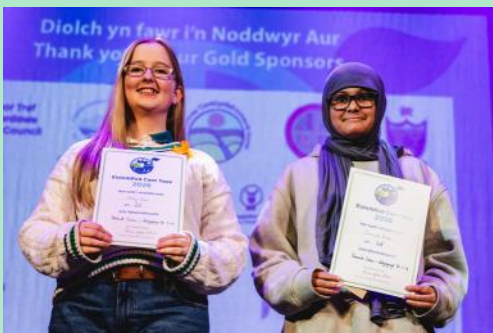
Dwy ddisgybl o Ysgol Pentrehafod yn profi llwyddiant ar yr Unawd i Ddysgwyr