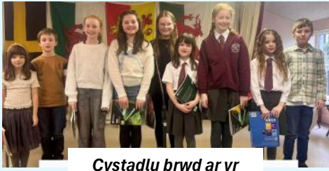
Cystadlu brwd ar yr Unawd Piano B16 ac iau