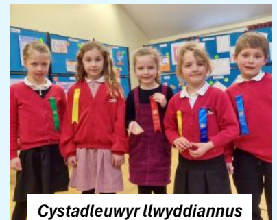
Cystadleuwyr llwyddiannus Blwyddyn 1 a 2