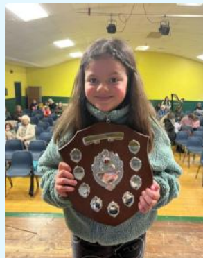
Enillydd Tlws Merched y Wawr am Ryddiaith Bl.5 a 6