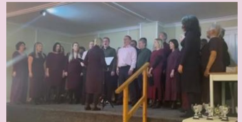
Côr Eifionydd - buddugol yn y gystadleuaeth i Gôr neu Barti Merched/Meibion/Cymysg