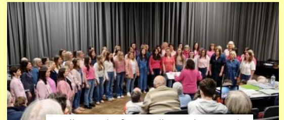
Enillwyr y brif gystadleuaeth gorawl - Côr Rhocesi