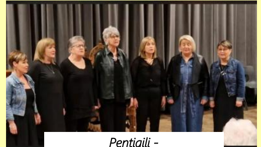
Pentigili - y parti llefaru agored buddugol