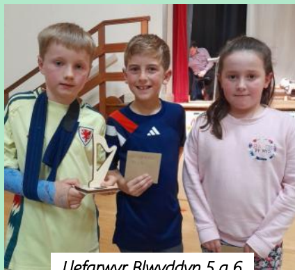
Llefarwyr Blwyddyn 5 a 6