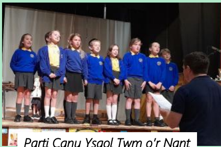
Parti Canu Ysgol Twm o'r Nant