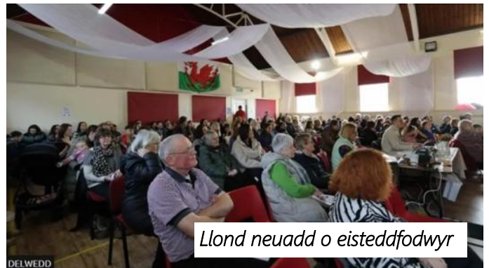
Llund neuadd o eisteddfodwyr