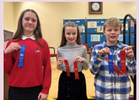
Offerynnwyr llwyddiannus yng nghystadleuaeth Bl 6 ac iau