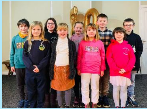
Parti Unsain a Pharti Llefaru buddugol Ysgol Garndolbenmaen