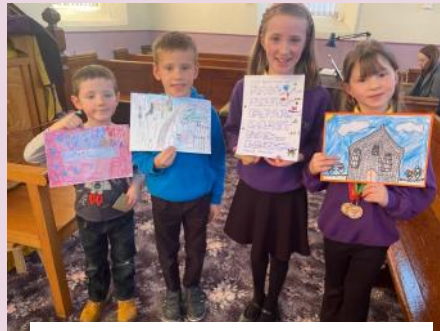
Arlunwyr oed cynradd a'u gwaith Celf buddugol ar thema 'Y Pentref'