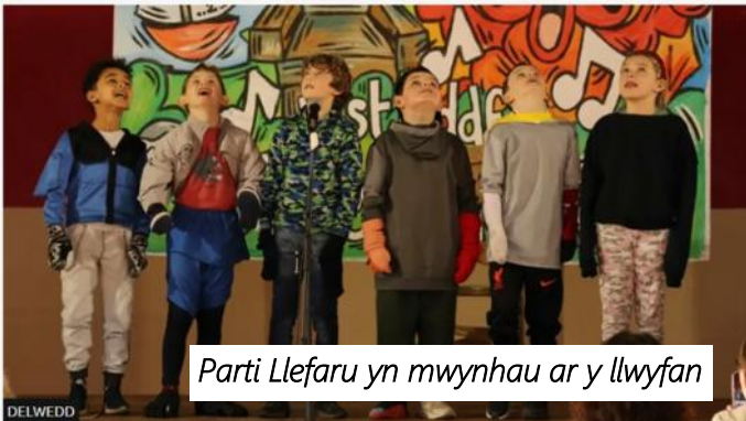
Parti Llefaru yn mwynhau ar y llwyfan